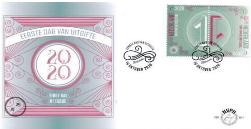
Fig 5 Nederland 2020 FDC NVPH E814 Dag van de postzegel

Maar in 2020 wordt het ineens weer interessant want van de Dag van de postzegel op cover E814 (fig 5) worden 5.725 covers verkocht en is de cataloguswaarde €8,-.