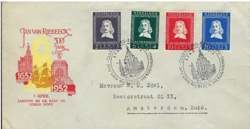
Fig 3 Nederland 1952 FDC NVPH E7