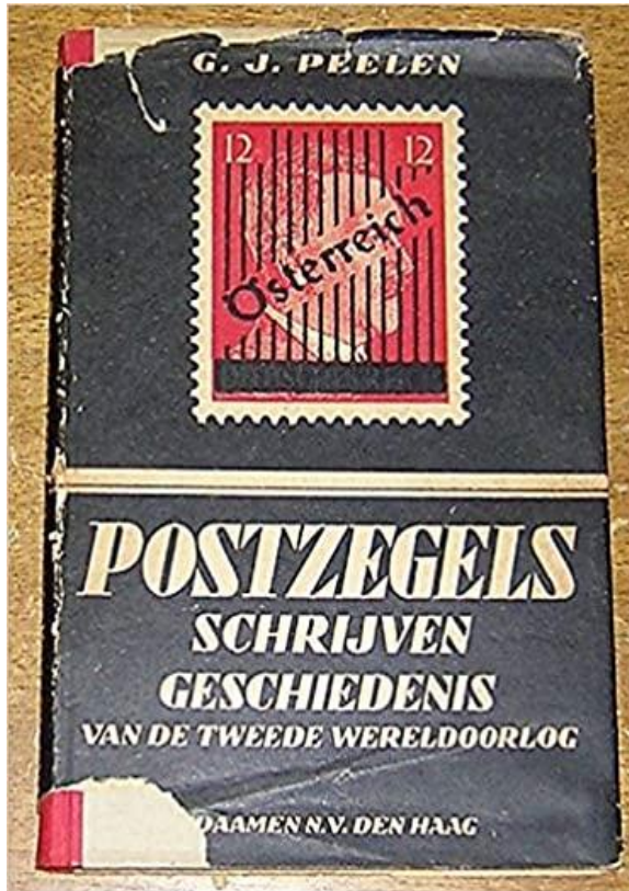
Fig 2 "Postzegels schrijven geschiedenis" G.J. Peelen