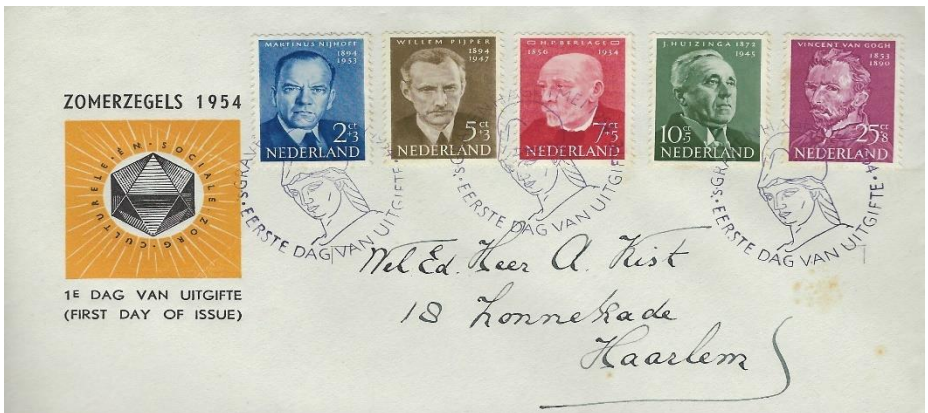
Fig 4 Nederland 1954 zomerzegels FDC NVPH E16

Ik kom er eerlijk voor uit. Als beursman was ik altijd al op zoek naar koopjes en in de filatelie is het niet anders. Ik lijkt wel een echte Hollander. Maar koopjes moet je nog steeds kopen en daar moet je dus wel geld voor hebben. Toen ik in de jaren zestig mijn eerste maandsalaris verdiende, bleef er maar weinig over voor koopjes. Maar wel zag ik dat nog maar enkele jaren eerder uitgegeven series, nu voor een veelvoud werden verkocht. De klapper was natuurlijk die eerste dag envelop E1 die in 1950 voor 68 cent (+ 15 cent voor