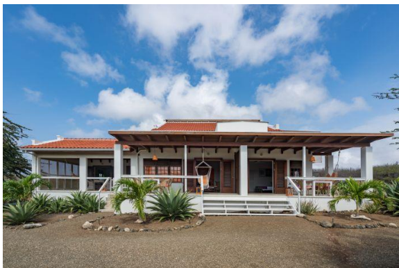
Fig 9 Curaçao Villa San Sebastian

Aangezien onze kinderen (5 stuks) allemaal in Nederland wonen en we de kleinkinderen zeker zullen gaan missen, komen we zo af en toe wel weer even in Nederland langs. Ik zal dat zeker proberen te combineren met een clubavond om u allen nog eens te ontmoeten.