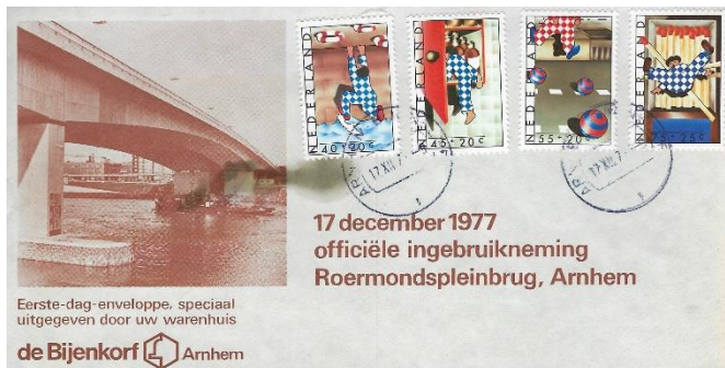
Fig 8 Eerste dag envelop uitgifte warenhuis De Bijenkorf Arnhem ter ere van de ingebruikneming van de Roermondspleinbrug in Arnhem

In die categorie valt de volgende envelop (fig 8). Het warenhuis De Bijenkorf in Arnhem gaf deze envelop uit op de eerste dag van uitgifte van de