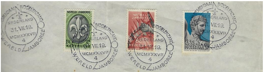
Fig 6 Wereld Jamboree 1937 NVPH 293/295 speciaal stempel 31-07-1937